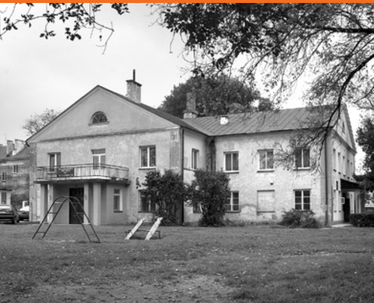
Synagoga nowomiejska, obecnie przedszkole