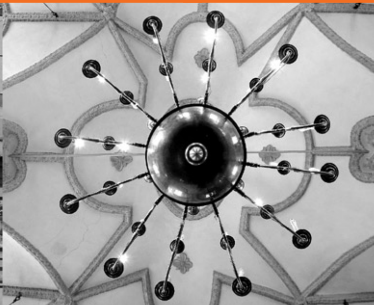
Sklepienie sali głównej, synagoga staromiejska