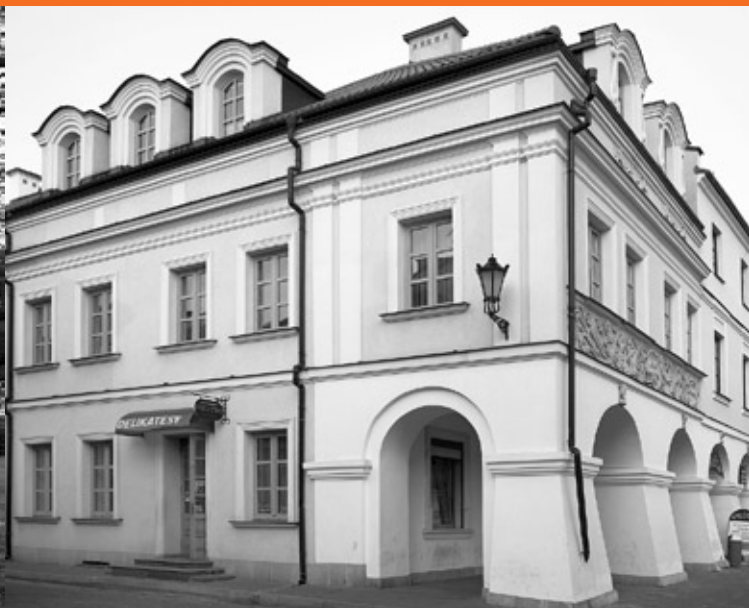
Dawny dom rabina