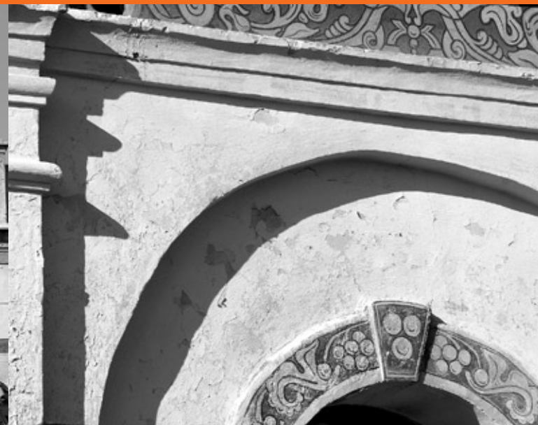
Elewacja, synagoga staromiejska

W tym czasie ludność żydowska stanowiła już większość mieszkańców miasta. W 1827 r. na 5 414 mieszkańców Zamościa było 2 874 Żydów, co stanowiło 53% ogółu mieszkańców. W 1857 r. na 4 035 mieszkańców było 2 490 Żydów. W 1897 r. w Zamościu mieszkało 7 034 Żydów, co stanowiło 62% ogółu mieszkańców miasta.