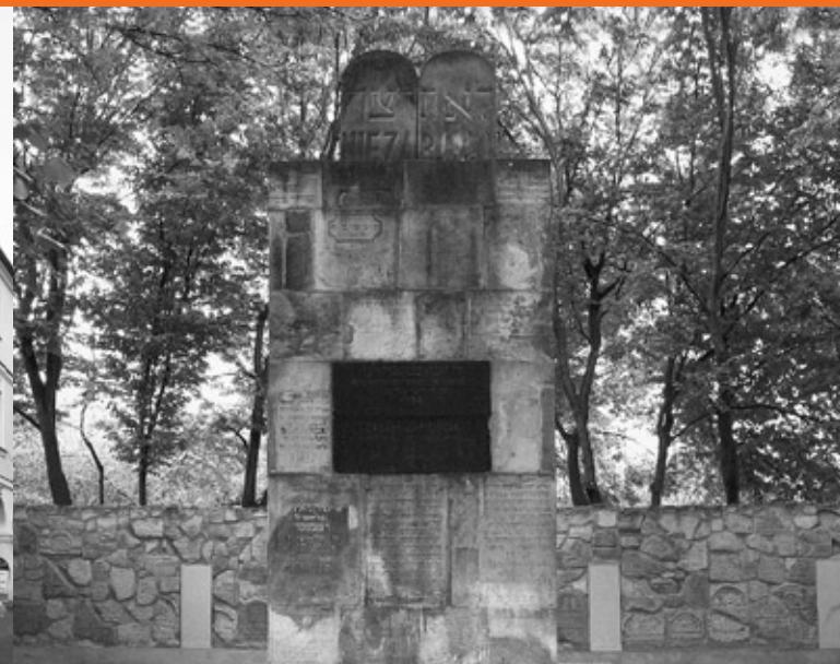
Pomnik upamiętniający zamojskich Żydów, nowy cmentarz