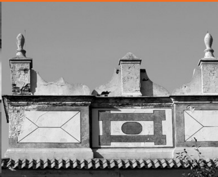
Attyka, synagoga staromiejska