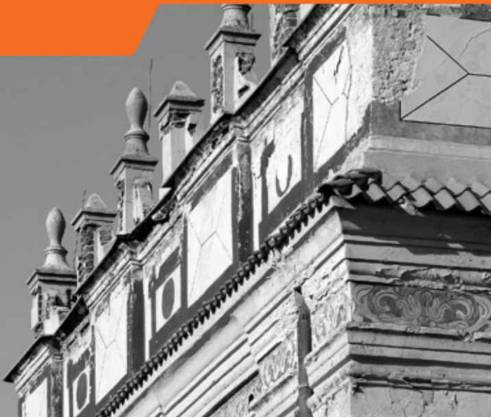
Attyka, synagoga staromiejska