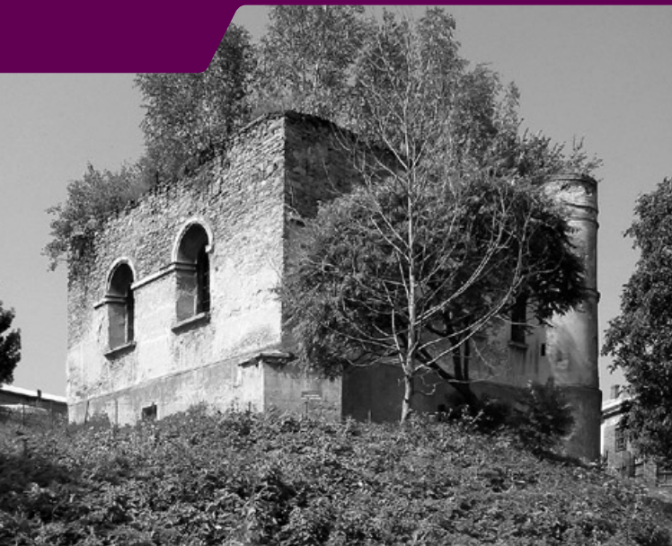
Synagoga, stan przed 2005