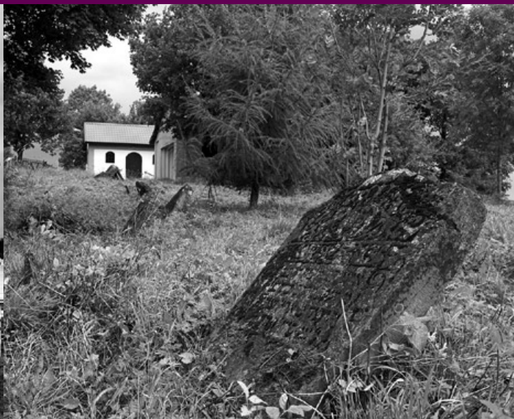
Cmentarz, w głębi ohel