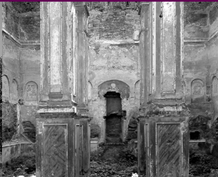
Synagoga, wnętrze, stan przed 2005