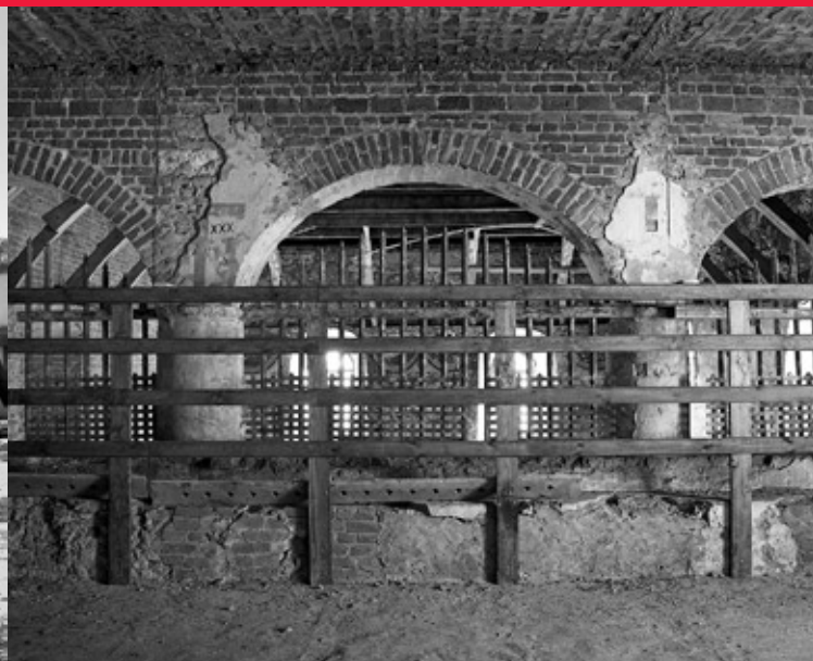
Wielka synagoga, babiniec