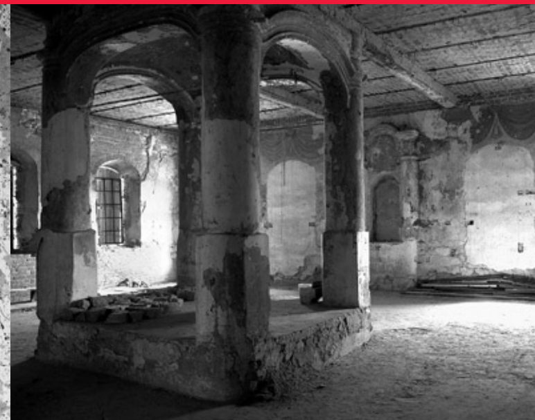
Mala synagoga, sala główna

rodzaj podatku wprowadzonego w 1549 r., a ponadto różne podatki nadzwyczajne według ogólnych państwowych zasad. Właścicielowi miasta każdy Żyd płacił za prawo zamieszkiwania podatek składający się z czynszu i korzennego, a Żydzi mieszkający w centrum miasta płacili ponadto i łazienne. Domy, w których mieszkali rabin i kantor, były wolne od opłat.