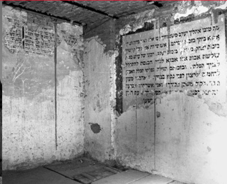
Mała synagoga, wewnątrz