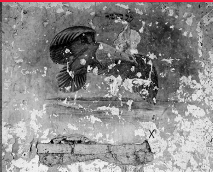
Wielka synagoga, fresk w sali głównej