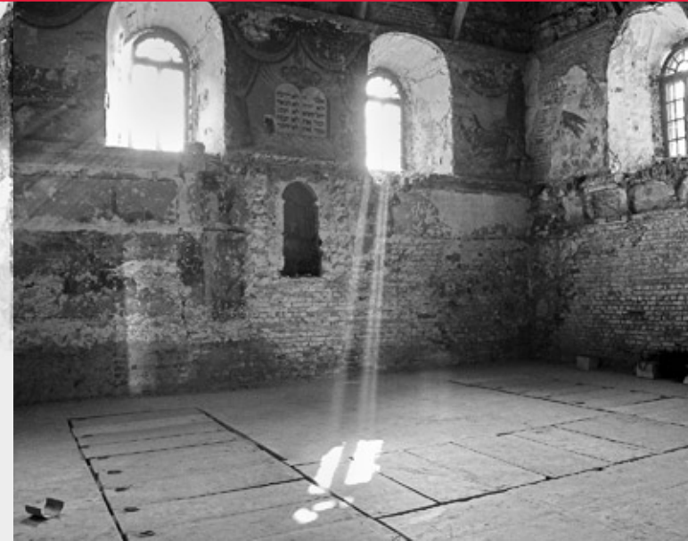
Wielka synagoga, sala główna