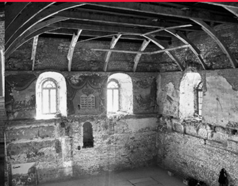
Wielka synagoga, sala główna

drewniana synagoga, o której jednak nie zachowały się żadne bliższe informacje. Obok stał dom, w którym mieszkał rabin. W obrębie murów miejskich był również żydowski szpital, służący zarazem za dom noclegowy dla podróżnych. W jego pobliżu mieszkał kantor.