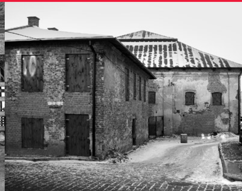
Mała i wielka synagoga