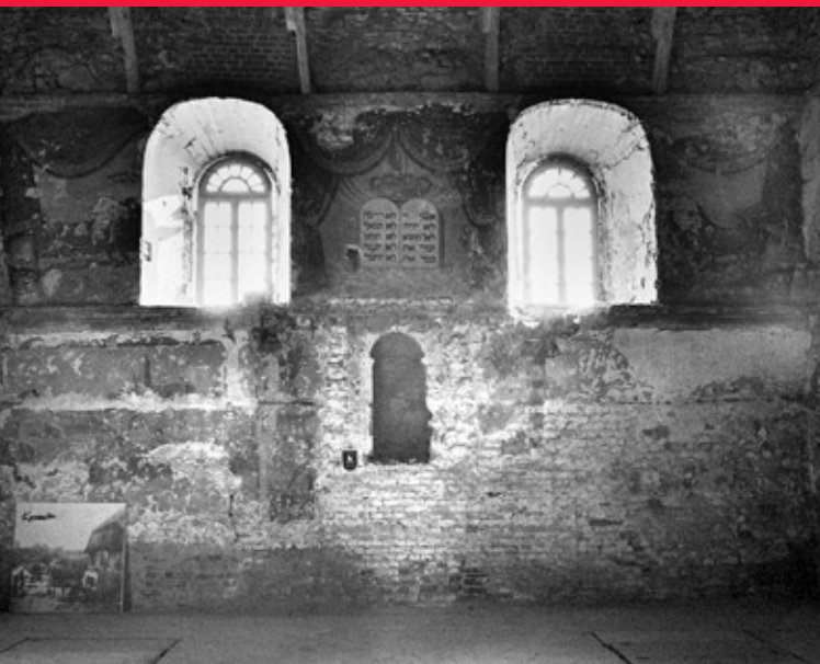
Wielka synagoga, sala główna