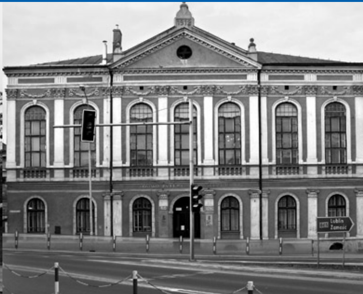
Gmach i synagoga Stowarzyszenia Jad Charuzim