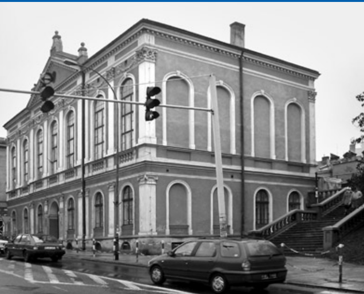
Gmach i synagoga Stowarzyszenia Jad Charuzim