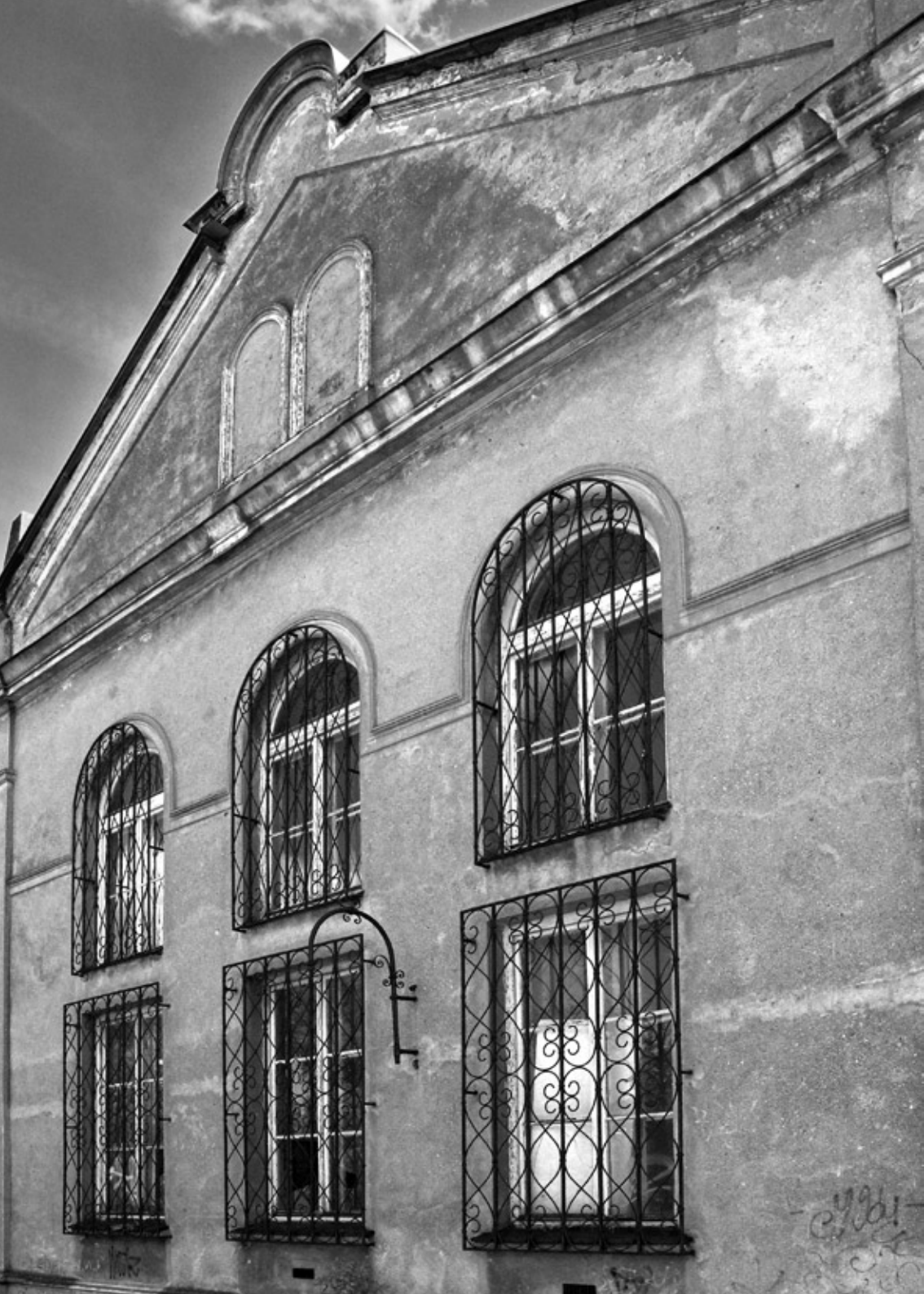
← Mała synagoga