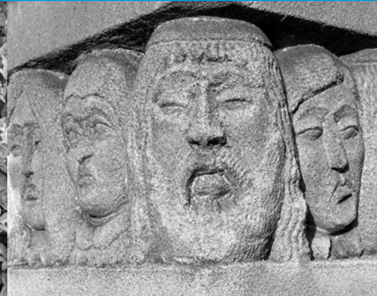
Nowy cmentarz, pomnik