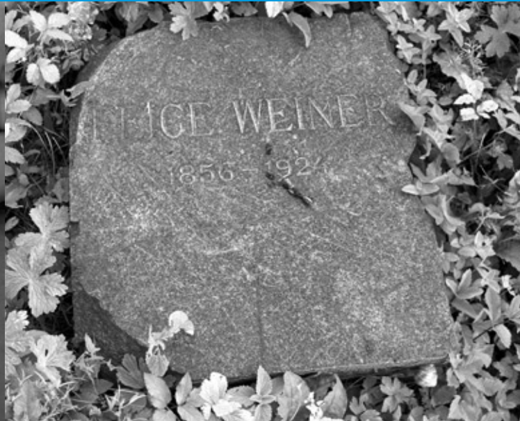
Nowy cmentarz, macewa