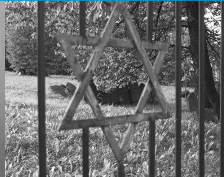
Nowy cmentarz, brama

Podkarpaciu systematycznie rosła – w tym czasie ziemie te stały się ważnym centrum gospodarczego i kulturalnego życia polskich Żydów.