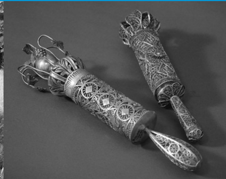
Oprawy na zwój Księgi Estery

Sanok, miasto w województwie podkarpackim, położone nad rzeką San, liczy obecnie ponad 40 tysięcy mieszkańców. Odwiedzają je liczni turyści, pragnący zobaczyć zgromadzone na sanockim Zamku bezcenne zbiory ikon i najbogatszą na świecie kolekcję prac Zdzisława Beksińskiego. W Sanoku można też zwiedzić największy w kraju skansen, wziąć udział w jednym z licznych wydarzeń kulturalnych, takich jak festiwale muzyki operowej czy jazzowej, przeglądy filmowe czy jarmarki folklorystyczne (ze słynnym Jarmarkiem Ikon na czele), a także spróbować ciekawych dań kuchni regionalnej.