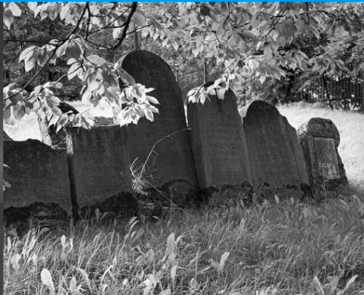
Nowy cmentarz, macewy